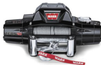
Treuil Warn Zeon 10 / 12v